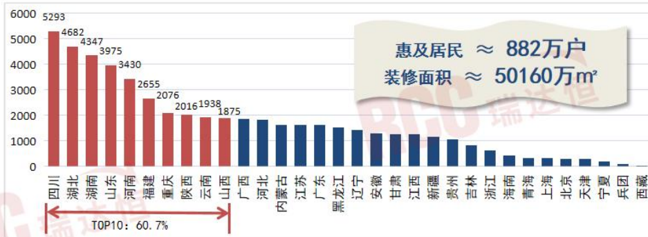
2023年1-11月全国各省市城镇老旧小区改造情况（个）